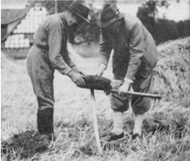
Der Bodenziegel ist vorsichtig herausgelöst und aufgenommen.

Vielleicht hat die Bodengesundheit irgendwie gelitten, was meistens der Fall ist.