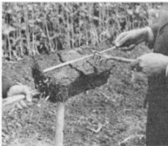
Die Untersuchung des Bodenziegels mit der „Kralle“ und Messstock.

Während der Wachstumszeit ist sicherlich manchem gut beobachtenden Landwirt dieses oder jenes Feldstück seines Betriebes aufgefallen das trotz guter Bestellung und vermeintlich ausreichender Düngung in der Entwicklung der Frucht die Erwartungen nicht erfüllte. Vielleicht hat die Bodengesundheit irgendwie gelitten, was meistens der Fall ist.